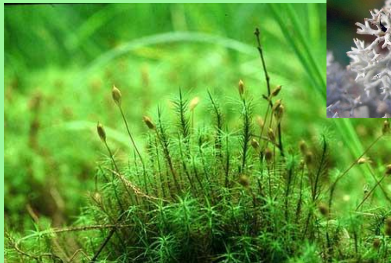
МОХ КУКУШКИН ЛЁН