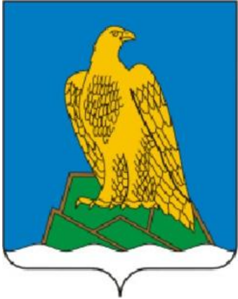
Герб и флаг Белорецкого района Башкортостана

Из российских регионов золотой беркут присутствует на гербе и флаге Белорецкого района Башкортостана и на флаге города Дальнереченска Приморского края. Из казахстанских регионов пара беркутов изображены на гербе города Костанай, который ассоциируется с такими понятиями как свобода, непокорность, чувство достоинства, мужество, высокие идеалы, широта души и чистота помыслов.