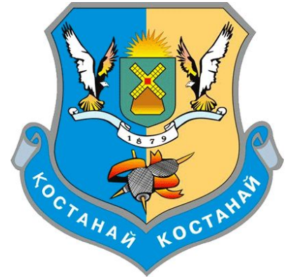
Герб города Костанай