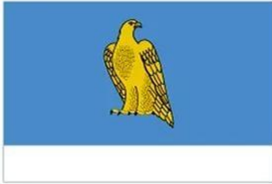
Флаг г.Дальнереченска Приморского края