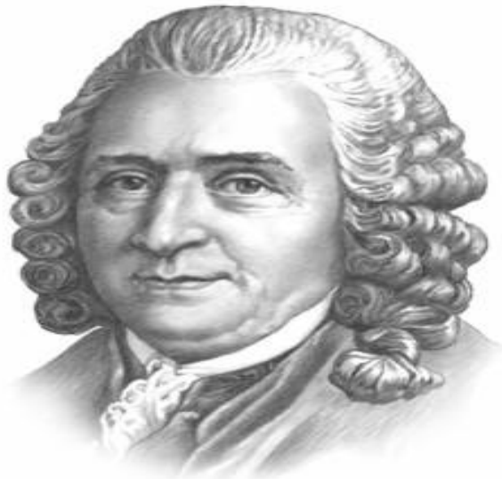
ЛИННЕЙ Карл 1707-1778

Карл Линней — шведский естествоиспытатель и врач XVIII века.