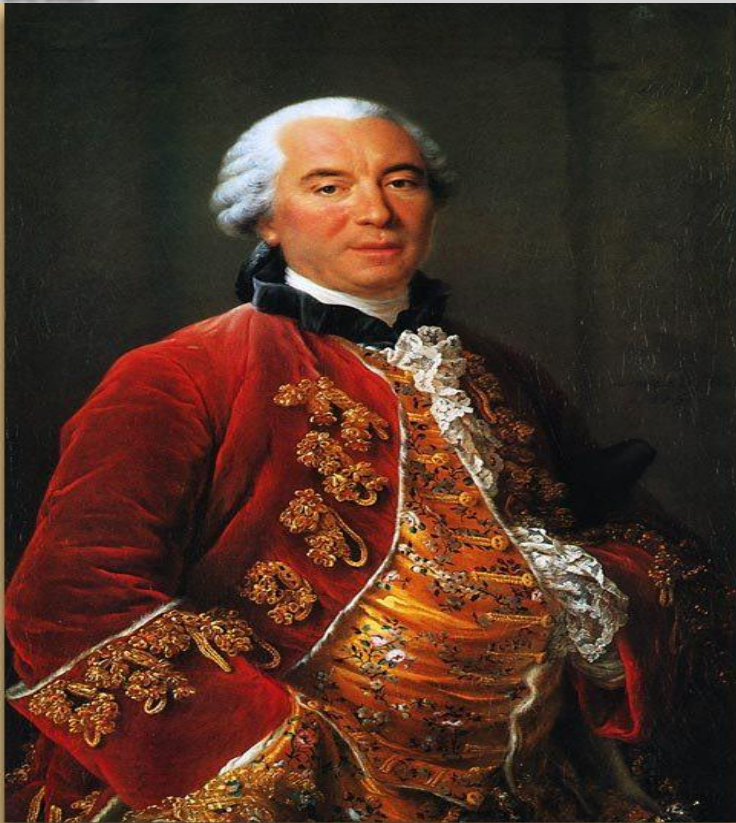
Musée Buffon à Montbard

Основана на идее единства живой природы и единого плана строения живых существ. Рассматривает происхождение видов от одного предка под влиянием среды и утверждает ограниченную изменчивость видов.