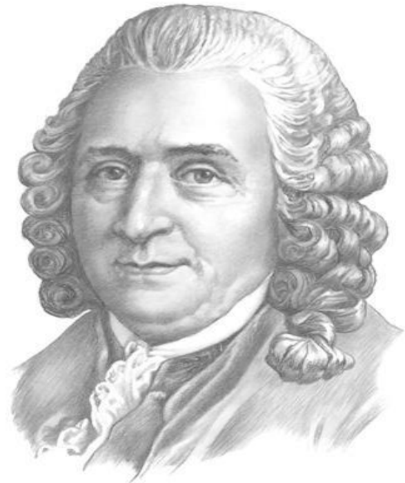
Карл Линней 1707—1778