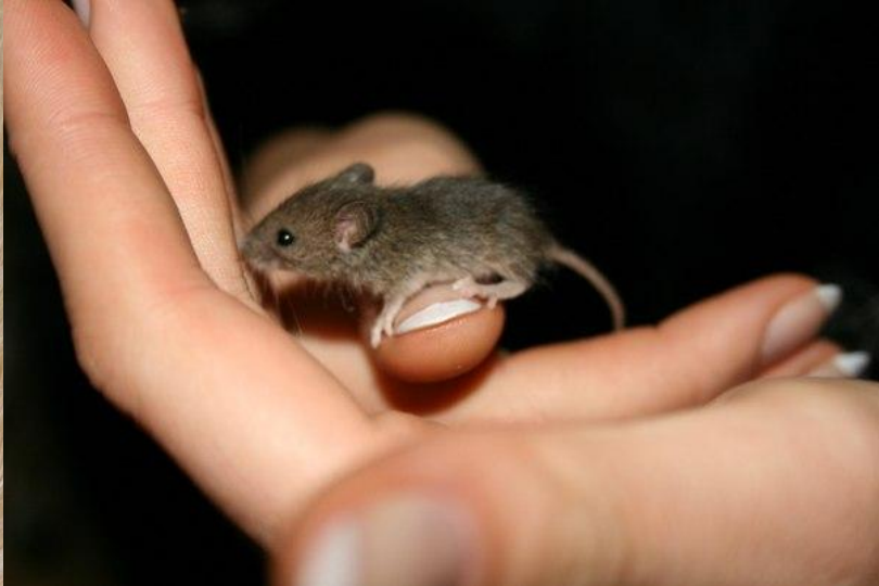
Карликовая белозубка Размер – 4 см, масса – 1,2 г