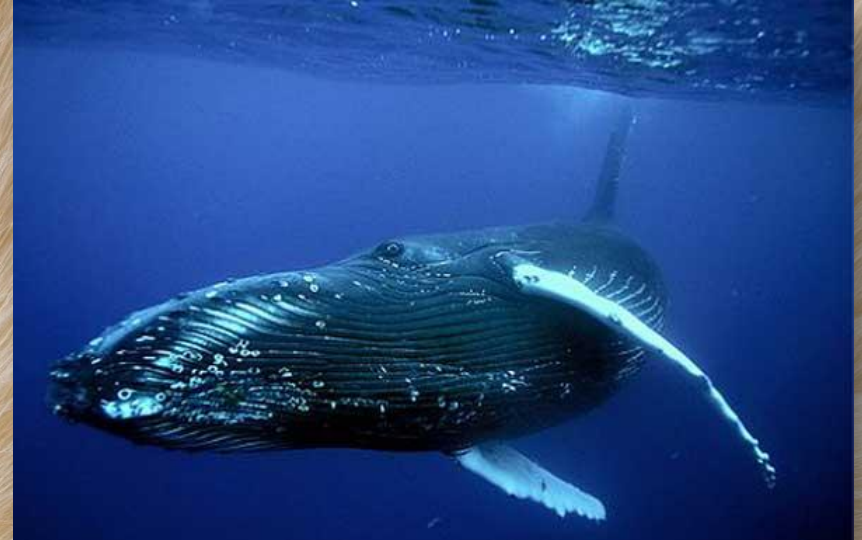
Синий кит Размер – 33 м, масса – 150 т