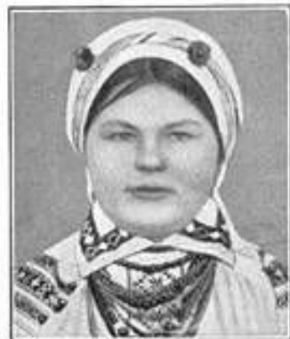
5. Ostbaltisch, helle Ostrasse: Ukrainische Wolhynierin.