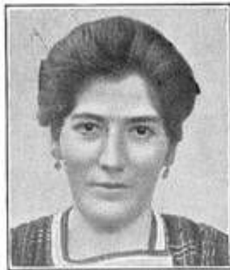
2. Dinarisch: Tirolerin.