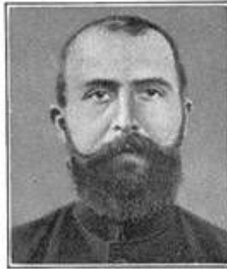
3. Mediterran, westisch: Korse.