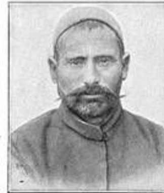
6. Türke aus Karahissar.