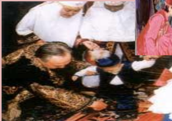
Тұсау кесер той