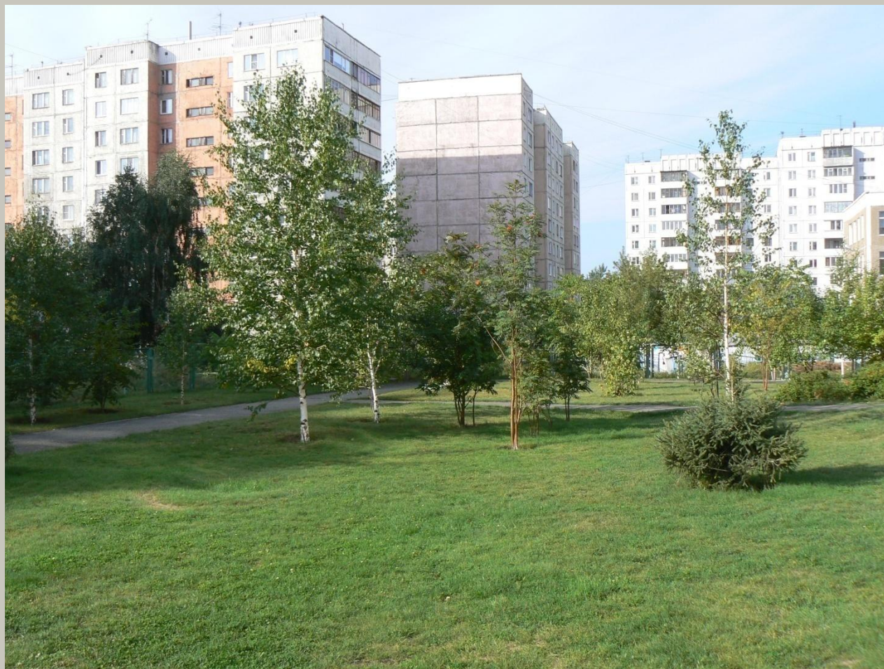
Береза повислая (бородавчатая)