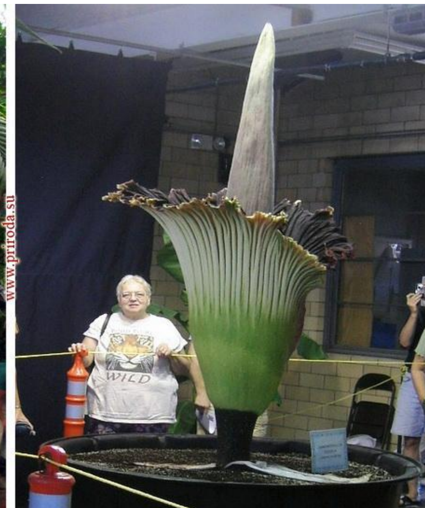
Аморфофаллус ( Amorphophallus ) (высота – 2,5 м., “тонким ароматом” разлагающейся плоти).