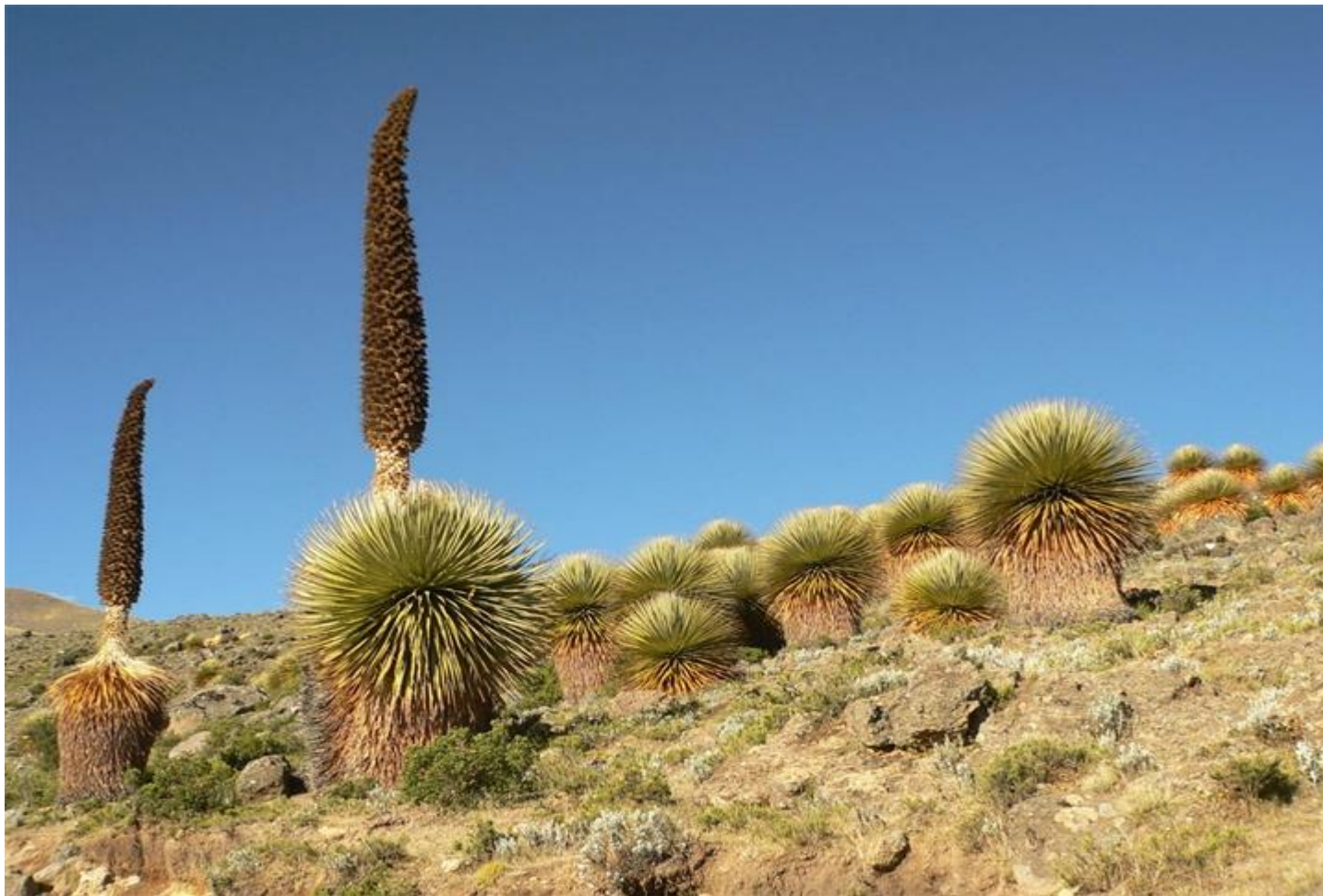
Пуйя Раймонда (имеет самое большое соцветие в мире)