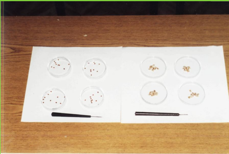
Определение всхожести семян