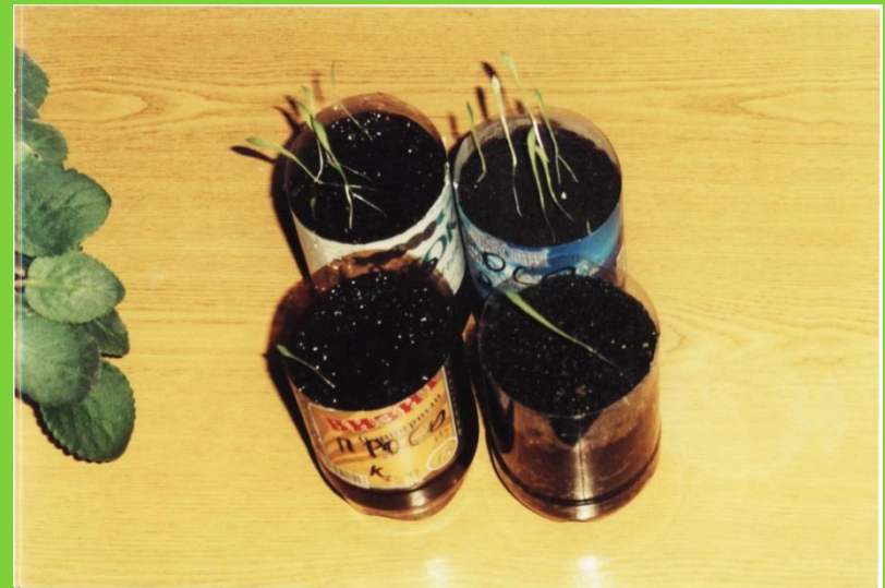
Влияние удобрений на всхожесть семян