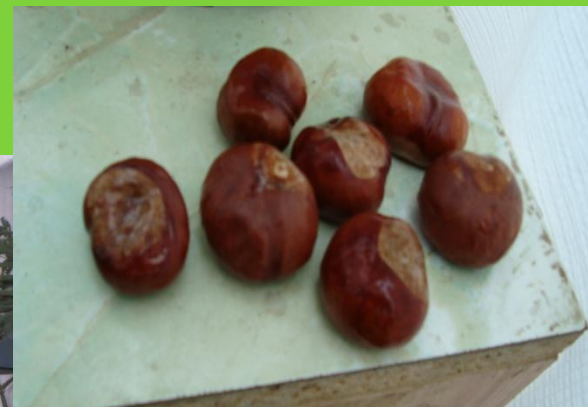
Проращивание семян каштанов