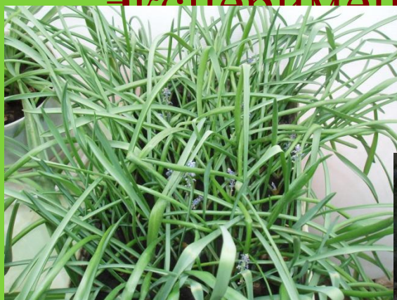
Выгонка луковичных в зимнее время