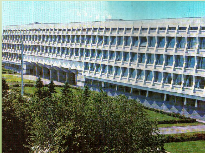
Ульяновский Государственный Ордена «Знак Почёта» педагогический институт им. И.Н.Ульянова

Он - физкультурник, биолог – я- Вот молодых педагогов семья.