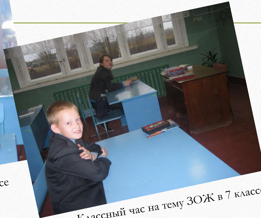
Классный час на тему ЗОЖ в 7 классе