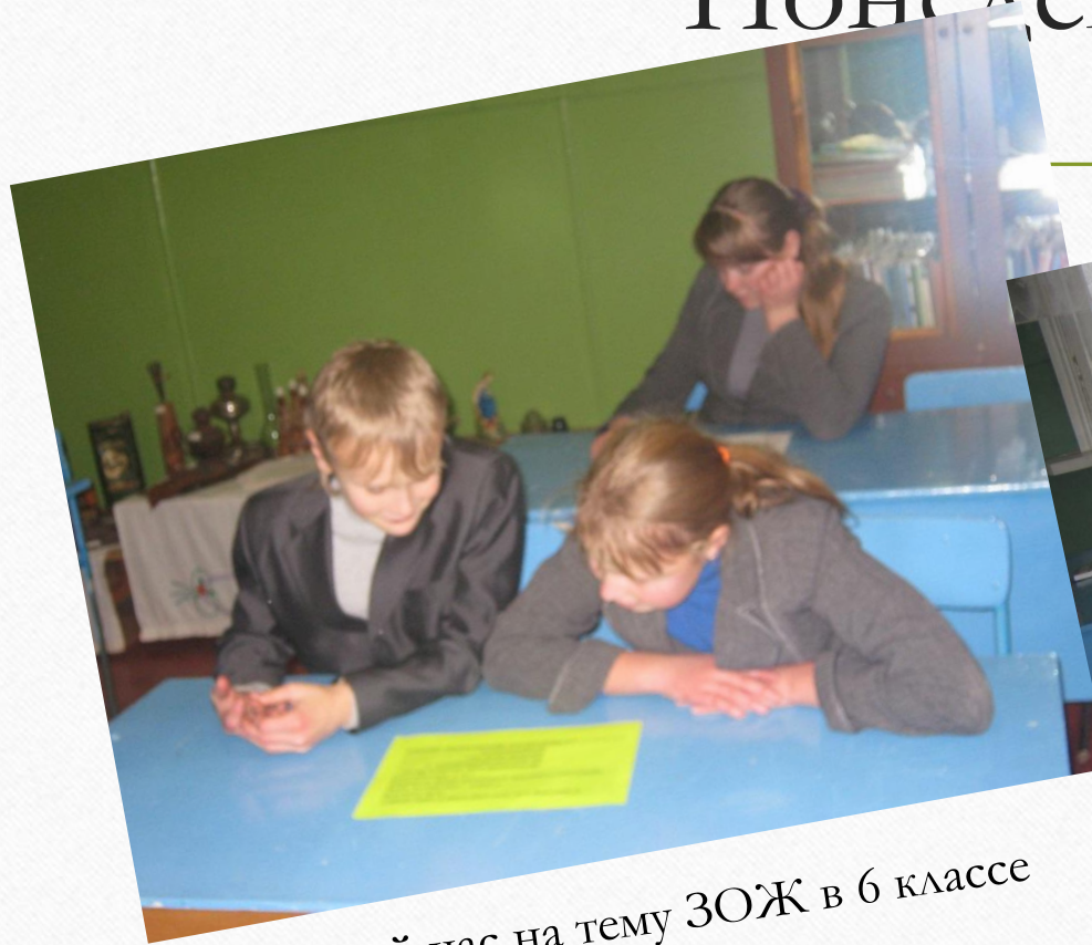
Классный час на тему ЗОЖ в 6 классе