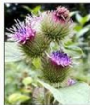
Плоды лопуха (репейника)