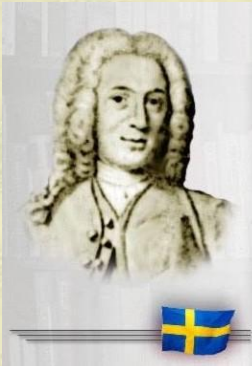
Карл Линней 18 век.