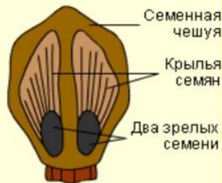
Вид семенной чешуи с верхней стороны