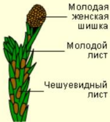
Женская шишка первого года до опыления