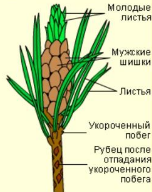
Группа мужских шишек