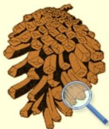
Женская шишка в конце третьего года