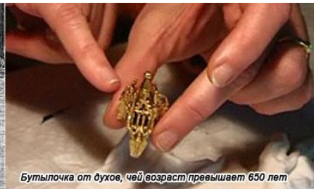
Бутылочка от духов, чей возраст превышает 650 лет