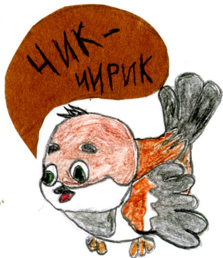
Воробей палевоый (деревенский)