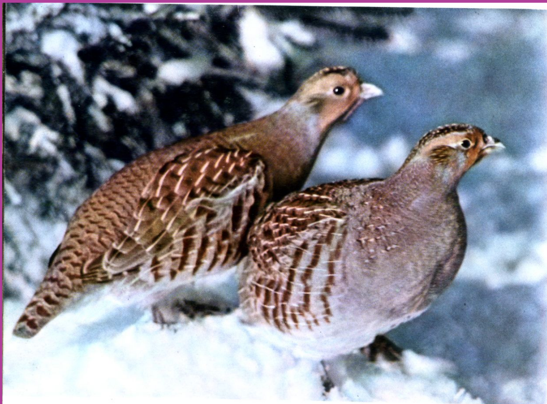
Х. Серая куропатка ( Perdix perdix )

Иллюстрированная энциклопедия птиц. Я. Ганзак. Восьмое переработанное издание 1990. Перевод Е. Фиштейна под редакцией И. А. Нейфельдт и П. М. Позднышева. Графическое оформление Ю. Гауфа // 1974 издательство Артия, Прага