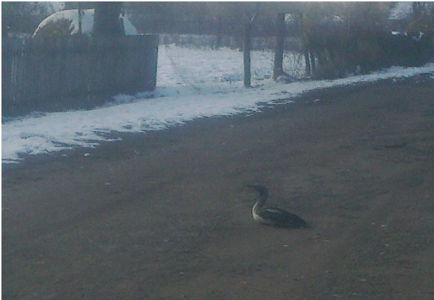
Гагара на дороге недалеко от школы. Октябрь, 2016 год.