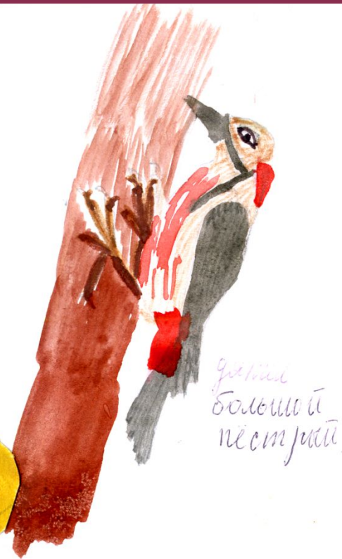
дятел большой пестрый