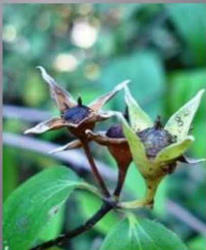
Коробочка с семенами