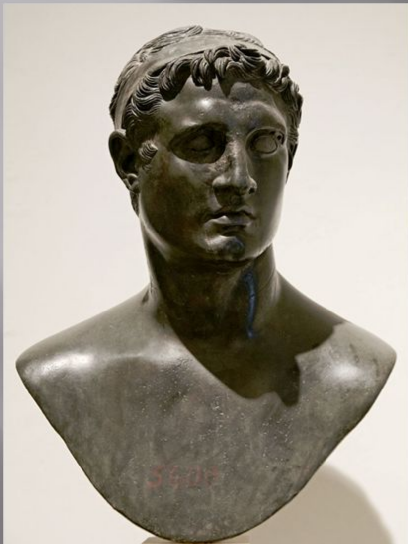
Царь Птолемей Филадельфус