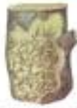
Лишайник обыкновенный Graphis aureola