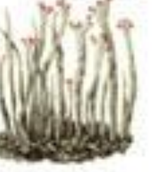
Лишайник обыкновенный Cladonia ciliata