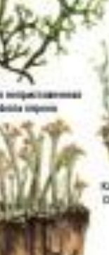
Лишайник обыкновенный Cladonia ciliata