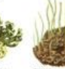
Лишайник обыкновенный Cladonia ciliata