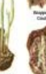
Лишайник обыкновенный Cladonia ciliata