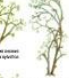
Лишайник обыкновенный Cladonia rangiferina