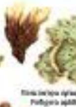
Лишайник обыкновенный Podopiza orbifolia