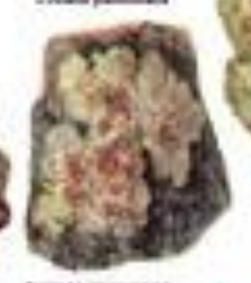
Лишайник обыкновенный Elvelia sylvatica