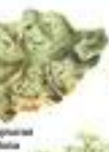
Лишайник обыкновенный Podopiza canina