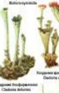
Лишайник обыкновенный Cladonia deformis