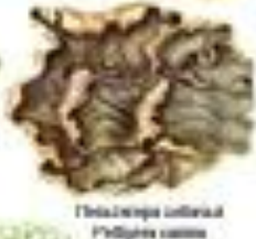
Лишайник обыкновенный Podopiza canina