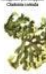
Лишайник обыкновенный Cladonia foliacea