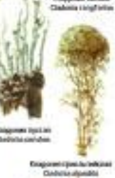
Лишайник обыкновенный Cladonia ciliata