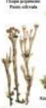
Лишайник обыкновенный Cladonia ciliata