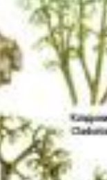
Лишайник обыкновенный Cladonia sylvatica