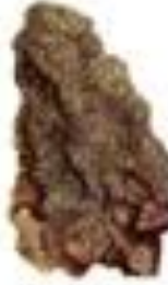
Лишайник обыкновенный Peziza ciliata