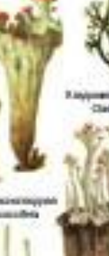
Лишайник обыкновенный Cladonia ciliata