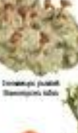
Лишайник обыкновенный Stictis sylvatica