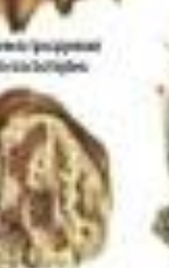
Лишайник обыкновенный Cladonia ciliata