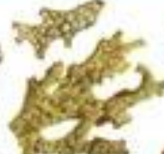
Лишайник обыкновенный C. varia pubescens