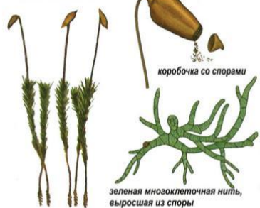
коробочка со спорами