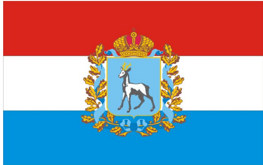
флаг Самарской области