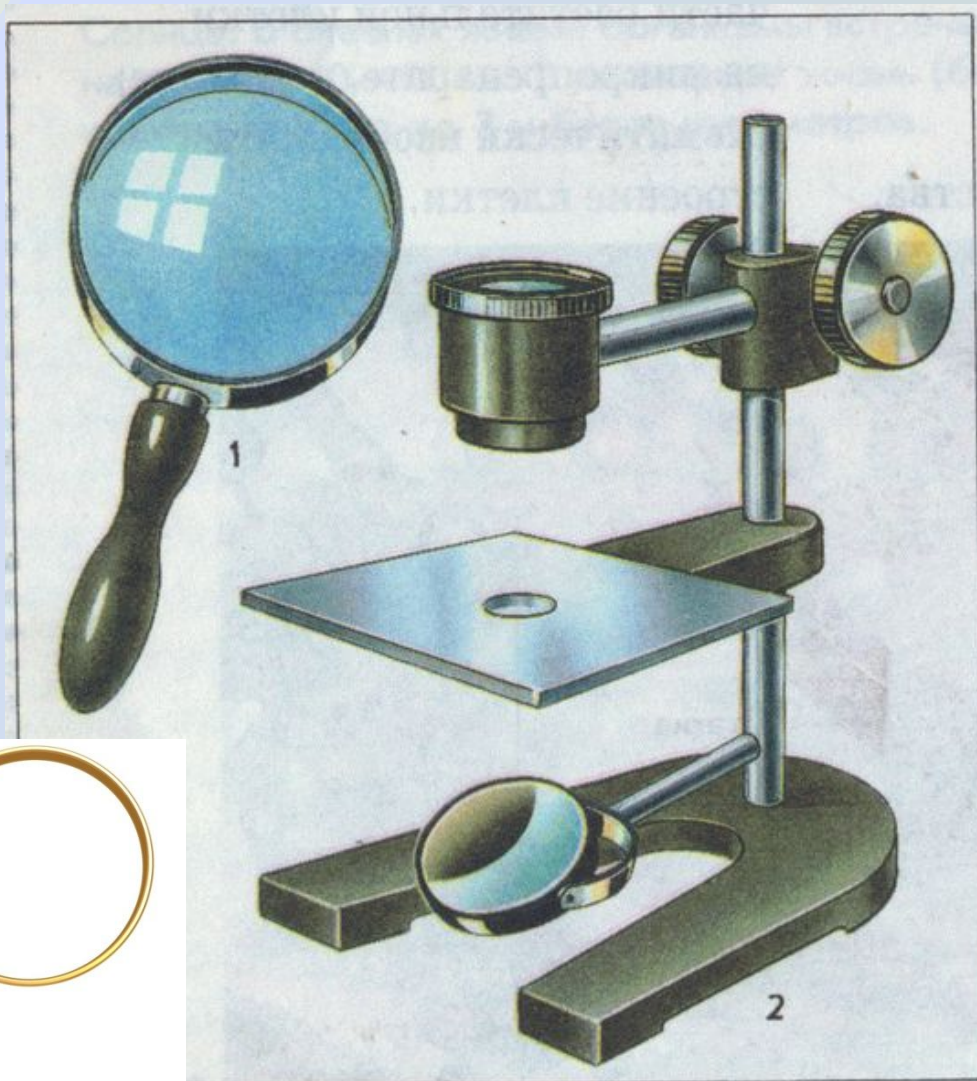
3. Лупы ручная (1) и штативная (2)