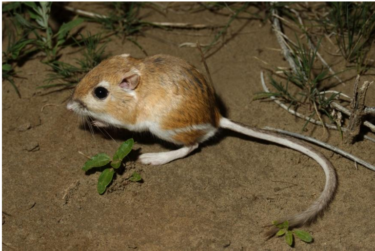
Тушканчиковая сумчатая крыса