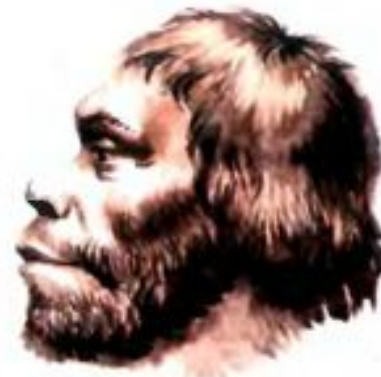
Рис. 8. Неандерталец