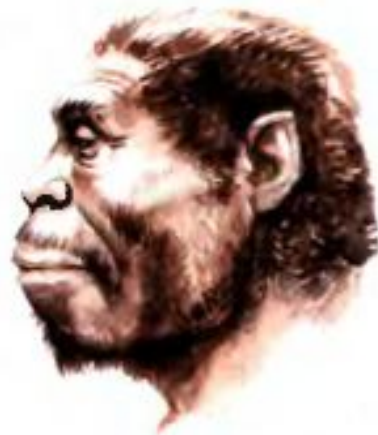
Рис. 7. Питекантроп