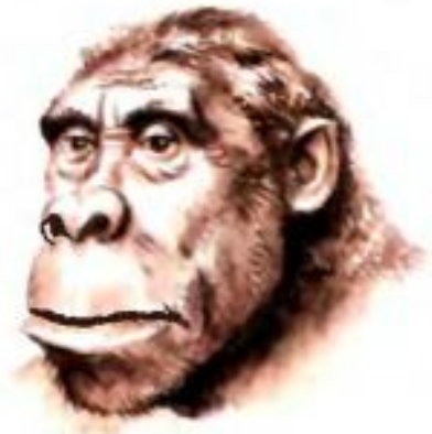
Рис. 6. Австралопитек