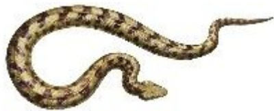
Амурский полоз удавчик