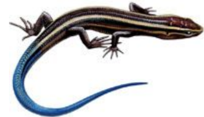
Североамериканский роющий сцинк