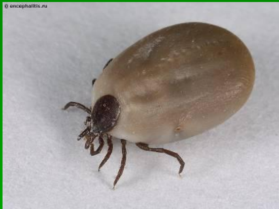
Насытившаяся самка иксодового клеща