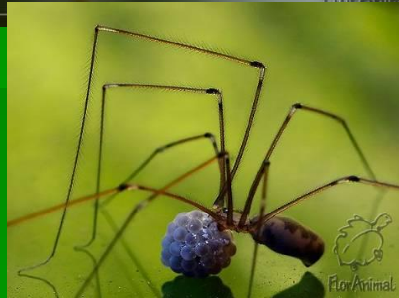
Сенокосец обыкновенный ( Phalangium orio ) ♀