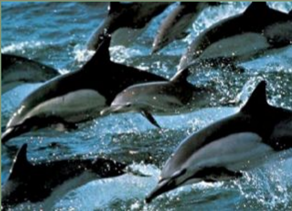
Обтекаемая форма тела