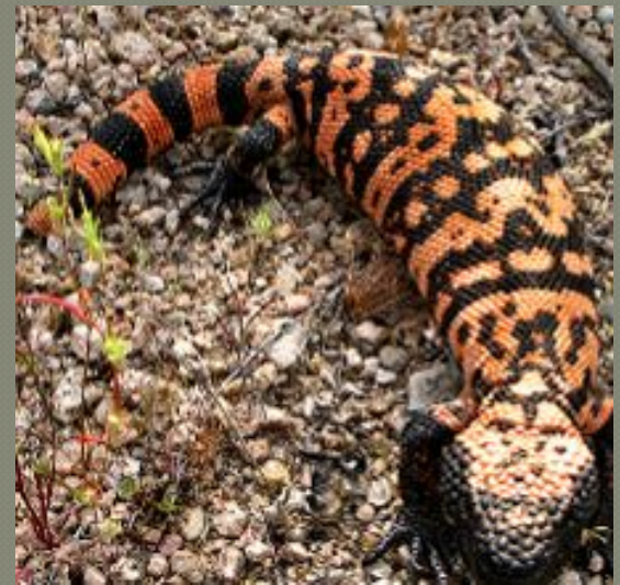
Ящерица - ядозуб