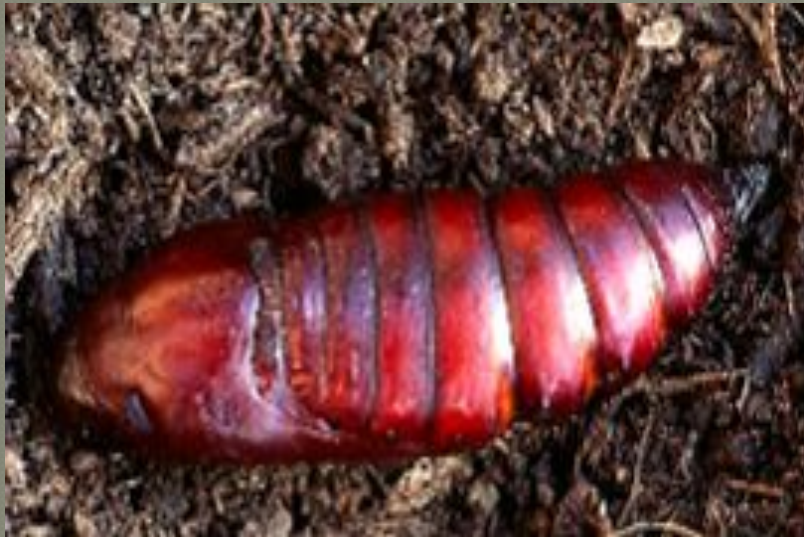
Личинки бабочки мертвой головой напоминают несъедобные объекты

Мимикрия – защитная окраска и форма тела, свойственная животным, не имеющим средств защиты. При этом – сходство с предметами окружающей среды, растениями или с защищенными животными