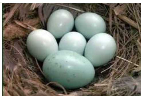
Горихвостка, яйцо кукушки в гнезде горихвостки

У открыто гнездящихся птиц самка, сидящая на гнезде почти неотличима от окружающего фона. Соответствует фону и пигментированная скорлупа яиц. Интересно, что у птиц, гнездящихся в дупле, на деревьях, самки нередко имеют яркую окраску, а скорлупа светлая.