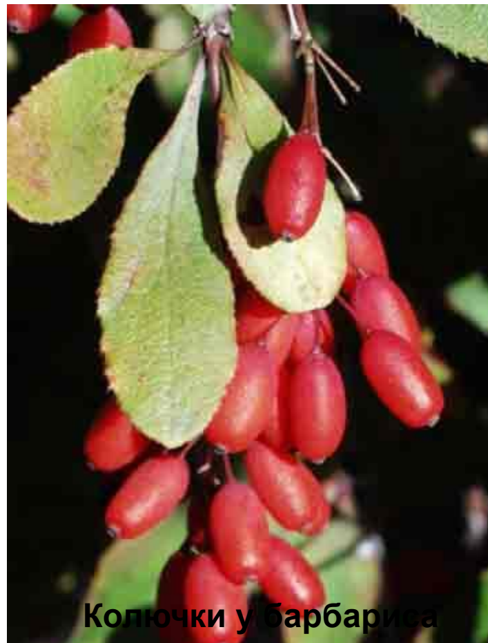
Колючки у барбариса