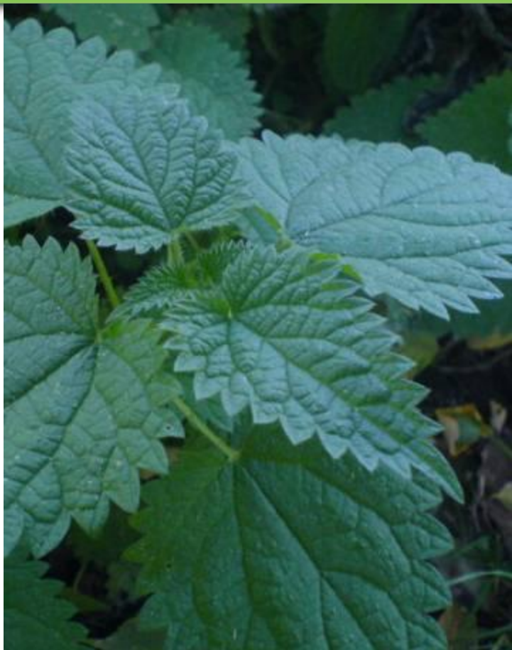
Обжигающие волоски крапивы