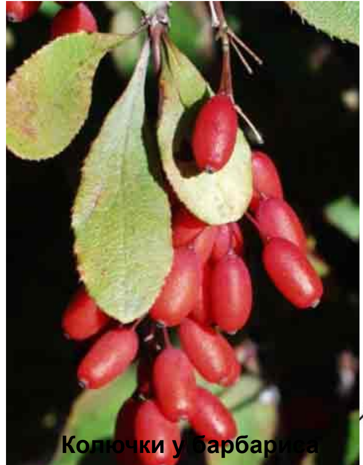
Колючки у барбариса