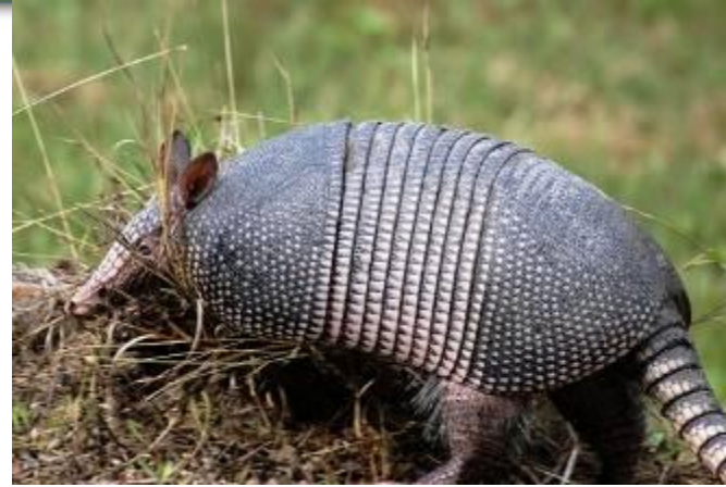
Панцирь у черепахи и броненосца