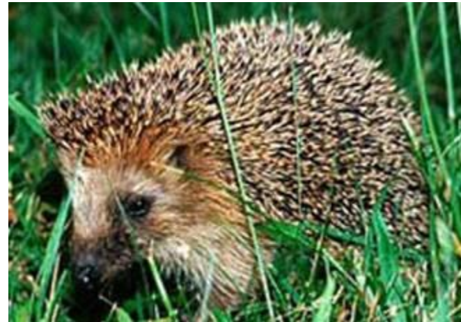
Иглы у дикобраза и ежа