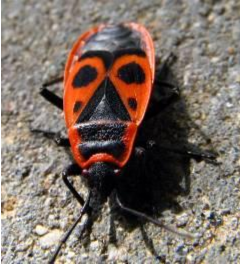
Клоп - солдатик