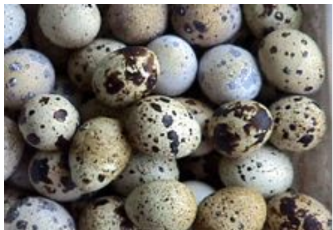
Перепел и его яйца