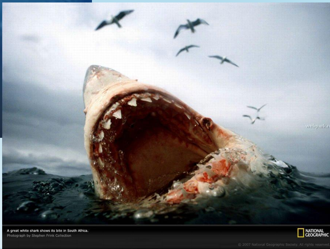
A great white shark shows its bite in South Africa.