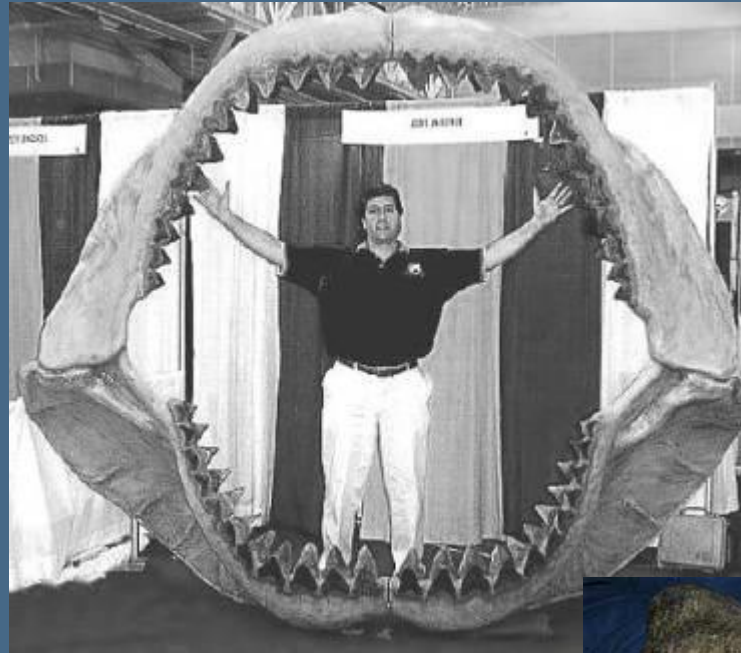
челюсть ископаемой акулы мегалодон