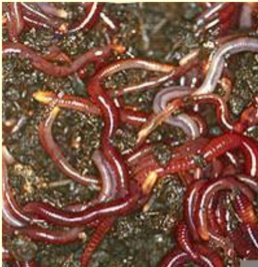
калифорнийский красный червь