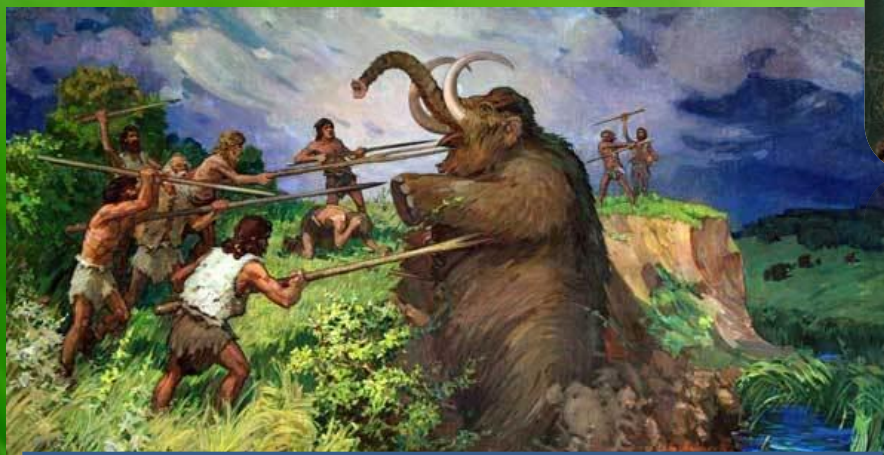
Охота на мамонта