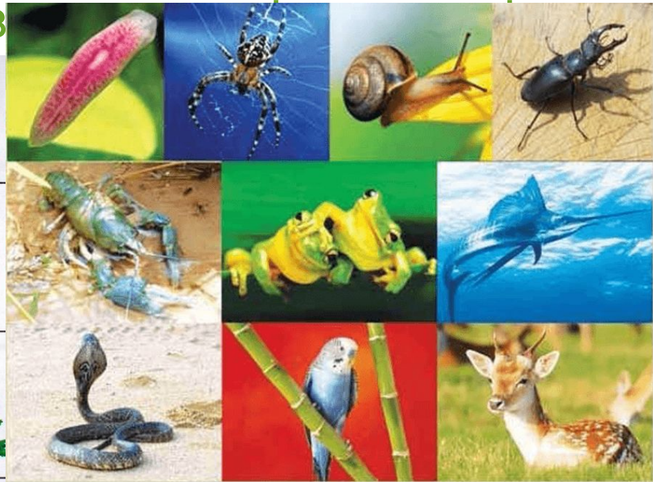
Мал. 122. Різноманітність тварин