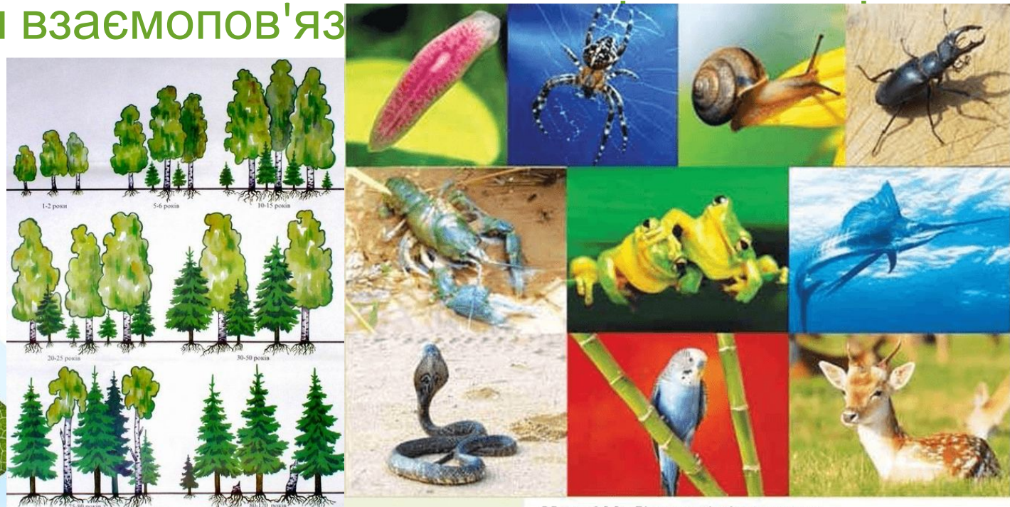
Мал. 122. Різноманітність тварин