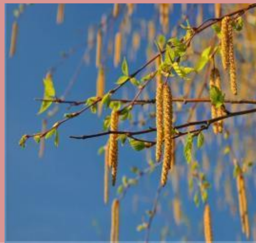
Лист кудрявой берёзы