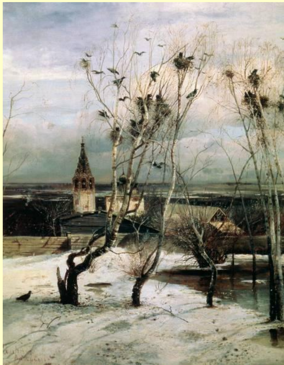
Саврасов А.К. Грачи прилетели.