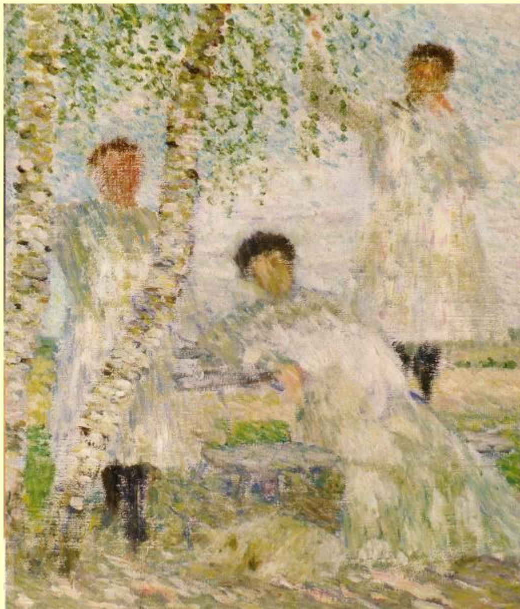
И.Э. Грабарь. Под берёзами.