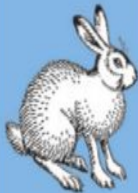
Вид Заяц- беляк