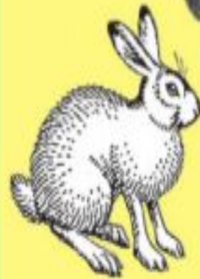
Отряд Зайце- образные