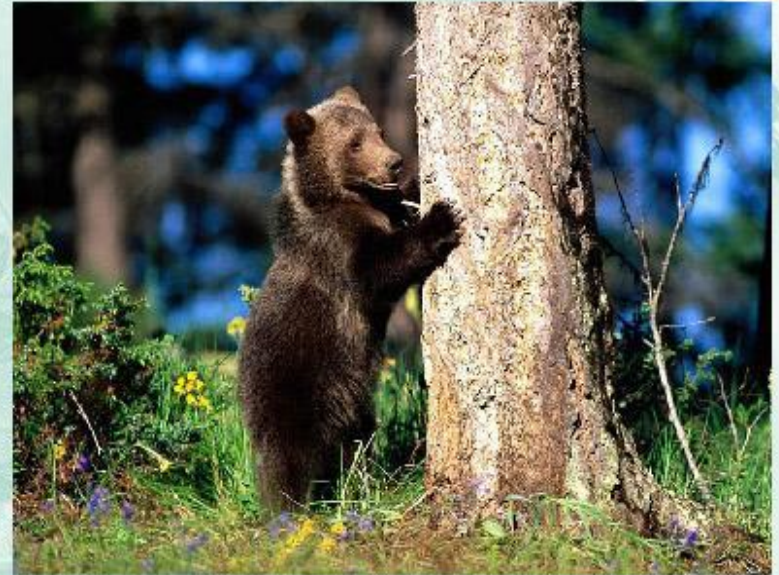
Бурые медведи метят свою территорию царапинами на деревьях.

Защита территории не всегда сопровождается активной борьбой (ритуальные поединки и демонстрация силы), обычно достаточно громкого пения (птицы), угрожающих поз, звуков, телодвижений или метки границ территории пахучим следом (млекопитающие), чтобы прогнать конкурента. Слабые особи оттесняются на периферию, а наиболее приспособленные захватывают лучшую территорию, оставляют потомство и передают свои гены следующему поколению - поэтому внутривидовая конкуренция это важный механизм, регулирующий размеры и рост популяций.