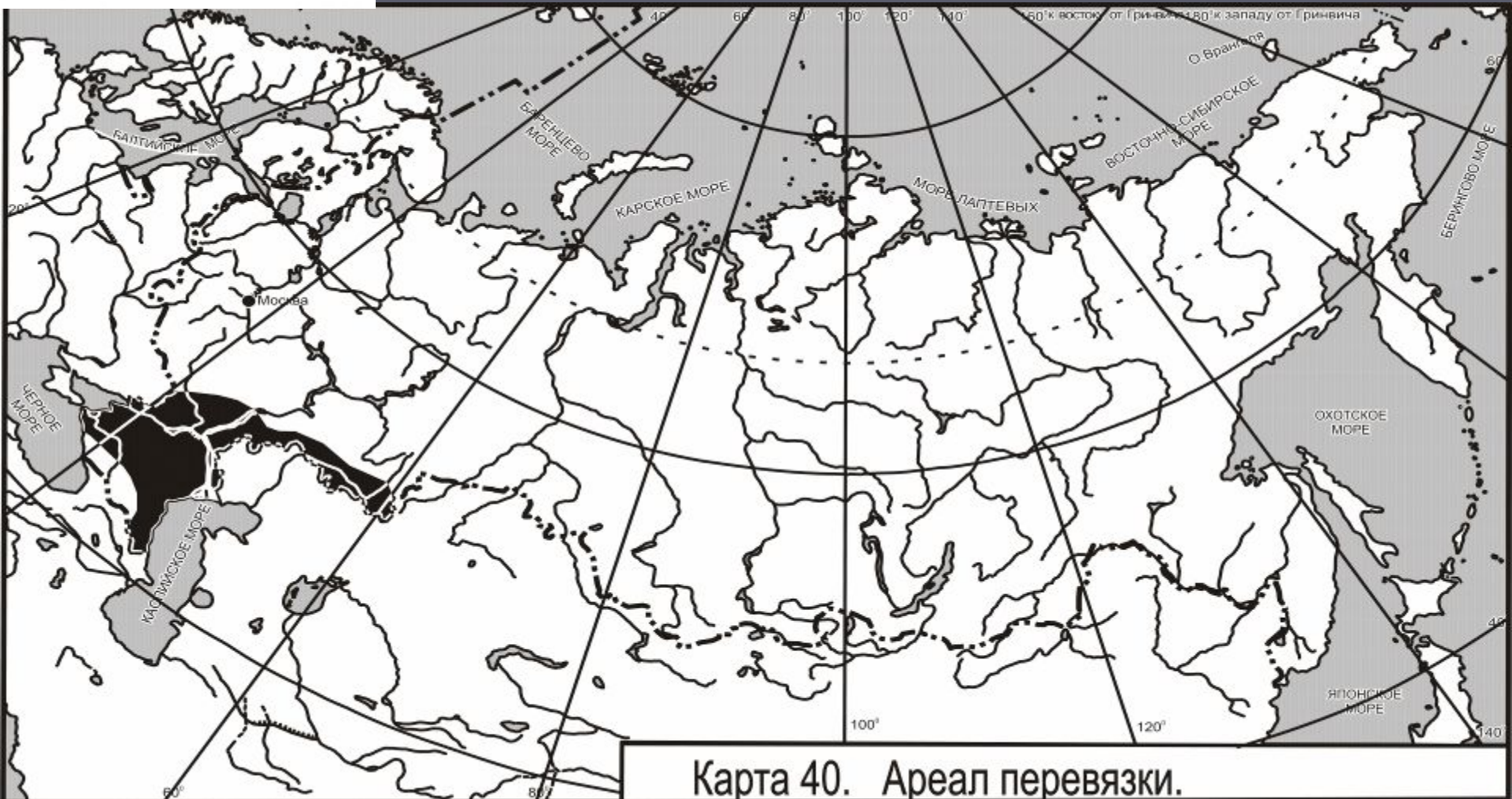
Карта 40. Ареал перевязки.