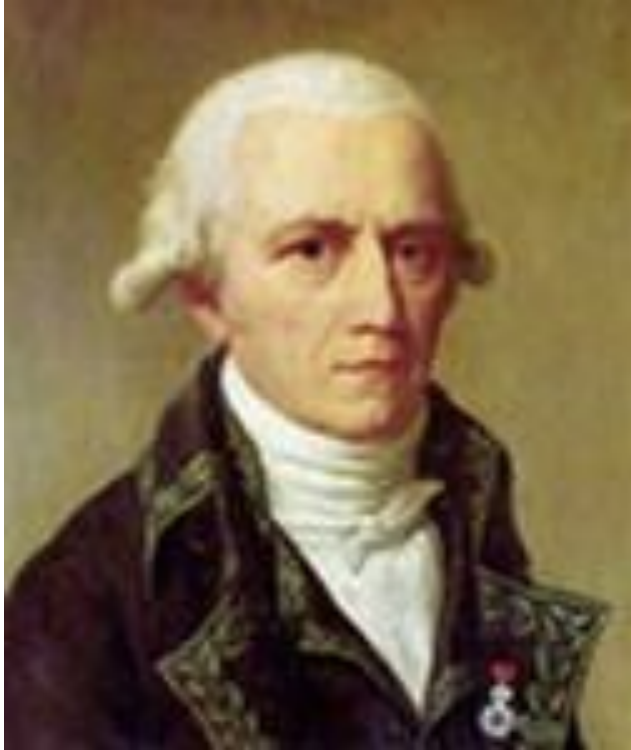
Ж. Б. Ламарк