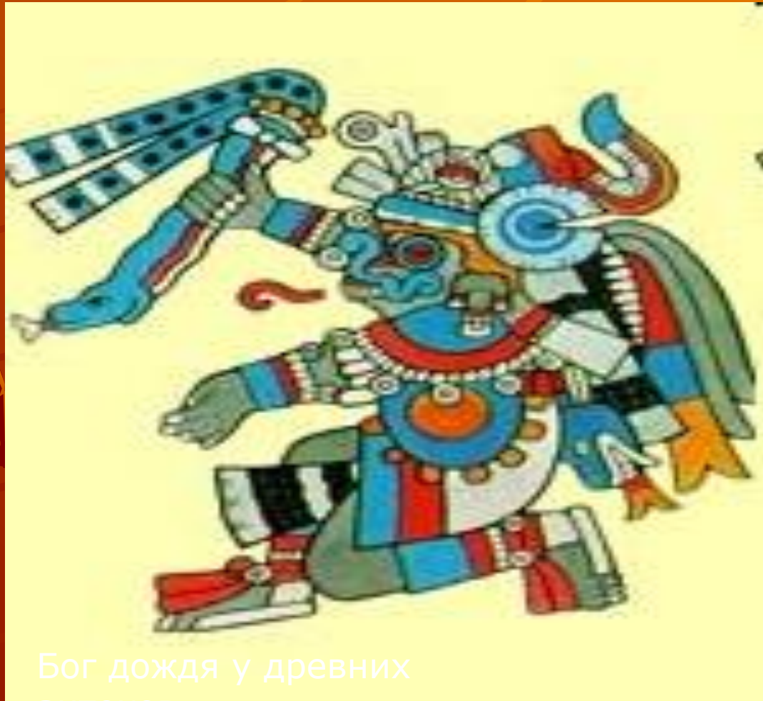
Бог дождя у древних ацтеков