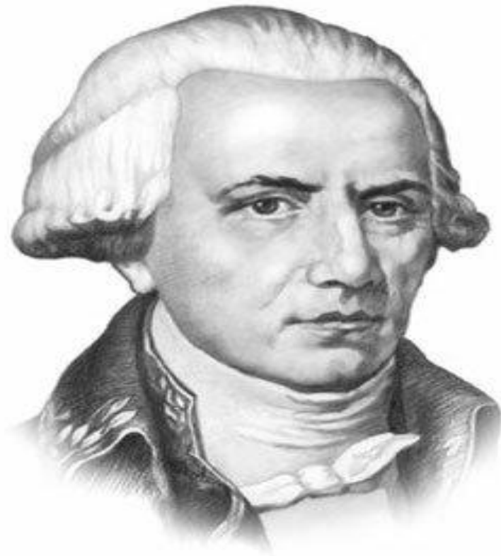
ЛАМАРК Жан Батист Пьер Антуан де Моне 1744-1829