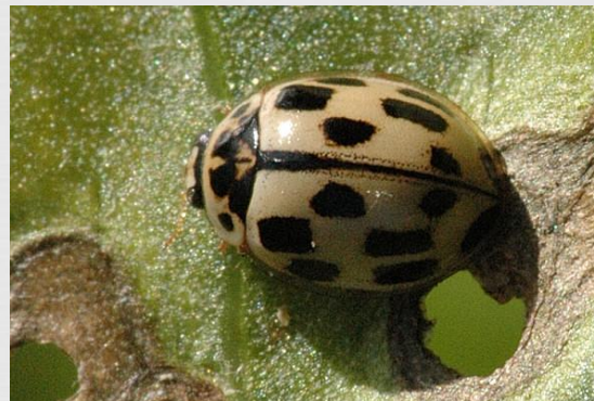
14-точечная божья коровка