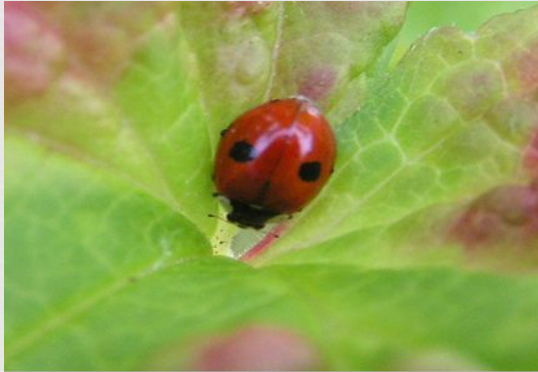
2-точечная божья коровка