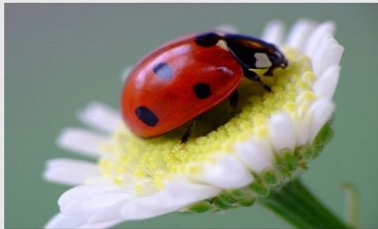
7-точечная божья коровка