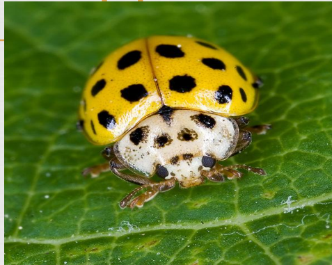
22-точечная божья коровка