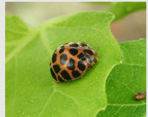
28 -точечная божья коровка