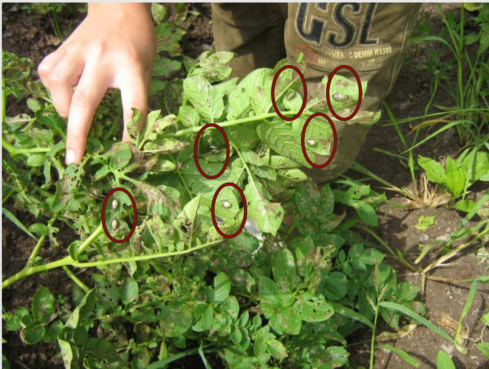
Личинки картофельной коровки