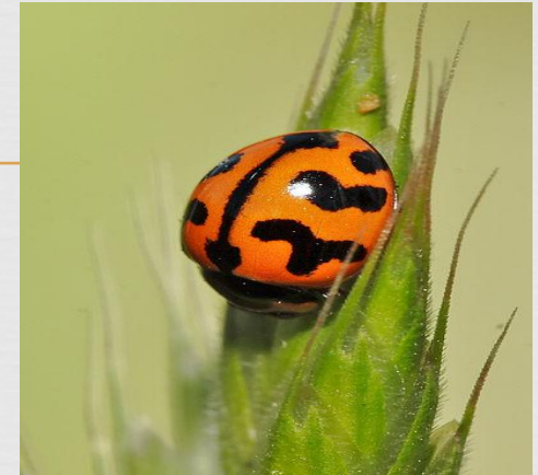
божья коровка из США