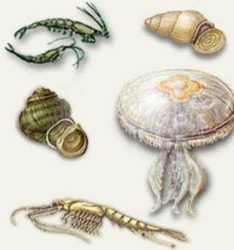
Животные, питающиеся фитопланктоном (медузы, моллюски, ракообразные)

С такими гигантами, о которых мы только что узнали, в морях и океанах спокойно соседствуют микроскопические водоросли. Они не опускаются на дно, но и не всплывают на поверхность, расположившись в толще воды. Все разнообразие этих водорослей-малышек объединяют общим названием фитопланктон (от греческих слов «фитон» - растение и «планктос» - блуждающий).