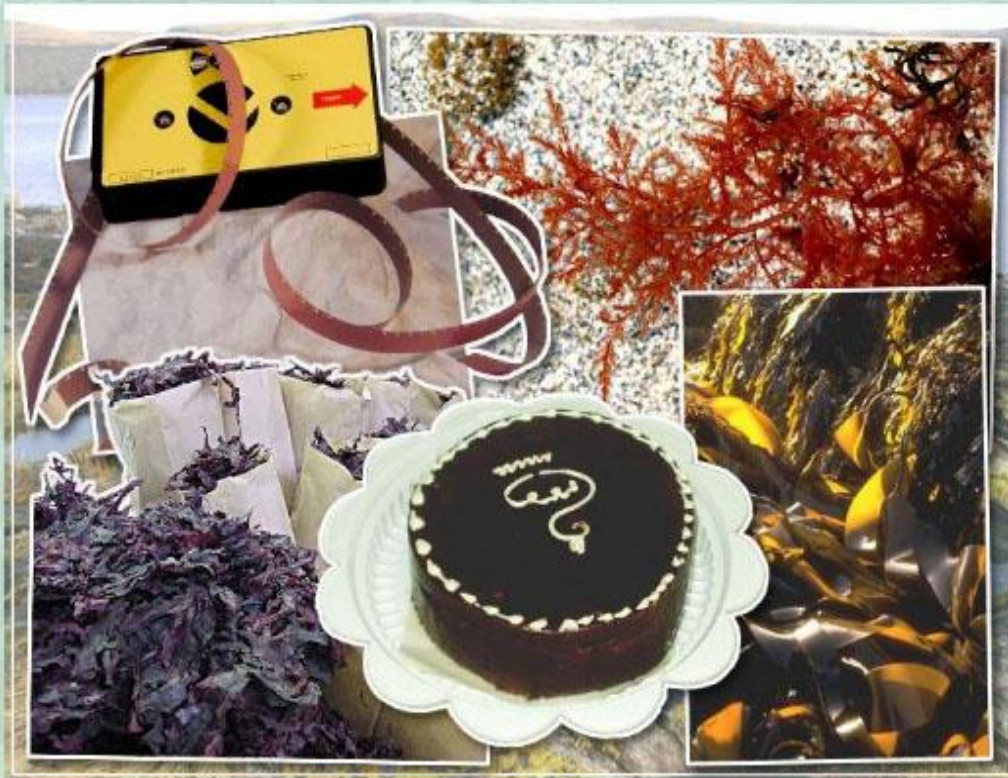
Использование водорослей человеком.

С давних времен люди научились использовать морские водоросли в пищу, в качестве лекарственных средств, в хозяйственных целях.