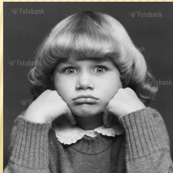
WWW.FOTOBANK.RU DV05-3949 Digital Vision RF Portrait of a Sulking Girl With Her Hands on Her Chin