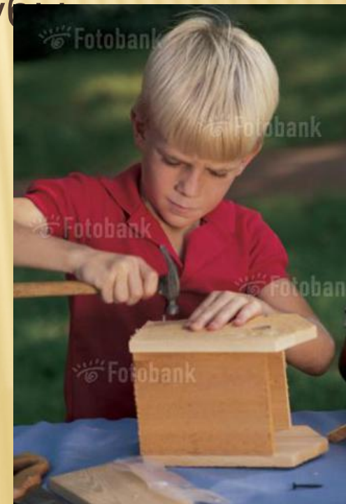
I102-6922 Boy building birdhouse