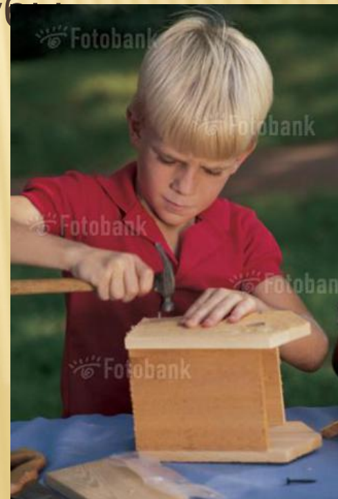
I102-6922 Boy building birdhouse