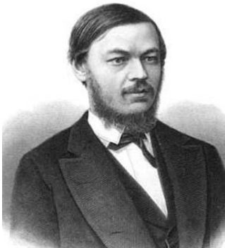
Сеченов Иван Михайлович (1829-1905)

Русский хирург. Создатель хирургической школы экспериментального направления. Разработал операции на спинном мозге.