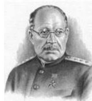
Бурденко Николай Нилович (1876 – 1946)

Изучал физиологию пищеварения, высшей нервной деятельности животных и человека. Выявил механизмы возникновения условных рефлексов