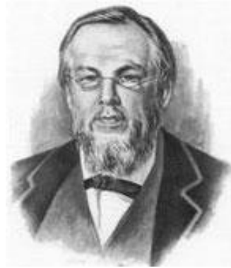
Боткин Сергей Петрович (1832 -1889)

Русский врач-терапевт. Создал учение, согласно которому организм представляет собой единое целое, а ведущую роль в его жизнедеятельности и связи с внешней средой играет нервная система.