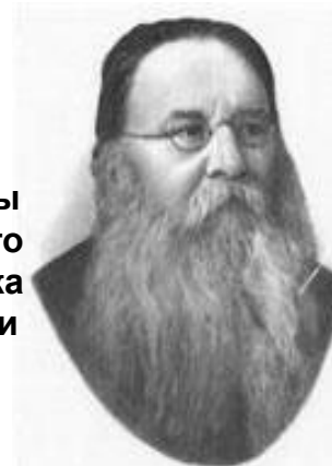
Ухтомский Алексей Алексеевич (1875 – 1942)

Основоположник русской школы физиологов. Доказал, что психическая жизнь человека является результатом деятельности клеток головного мозга.