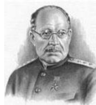
Бурденко Николай Нилович (1876 – 1946)

Изучал физиологию пищеварения, высшей нервной деятельности животных и человека. Выявил механизмы возникновения условных рефлексов