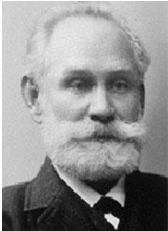
Павлов Иван Петрович (1849-1936)

Русский врач-терапевт. Создал учение, согласно которому организм представляет собой единое целое, а ведущую роль в его жизнедеятельности и связи с внешней средой играет нервная система.