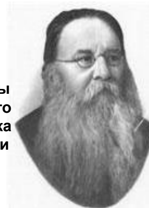
Ухтомский Алексей Алексеевич (1875 – 1942)

Основоположник русской школы физиологов. Доказал, что психическая жизнь человека является результатом деятельности клеток головного мозга.