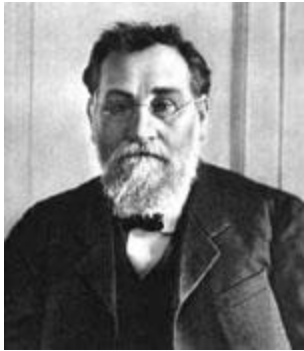
Мечников Илья Ильич (1845-1916) Автор фагоцитарной теории иммунитета