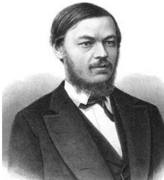
Сеченов Иван Михайлович (1829-1905)

Русский хирург. Создатель хирургической школы экспериментального направления. Разработал операции на спинном мозге.