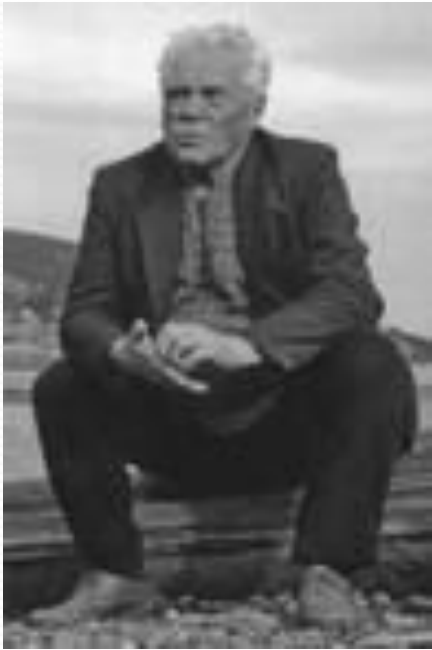
Виктор Петрович Астафьев