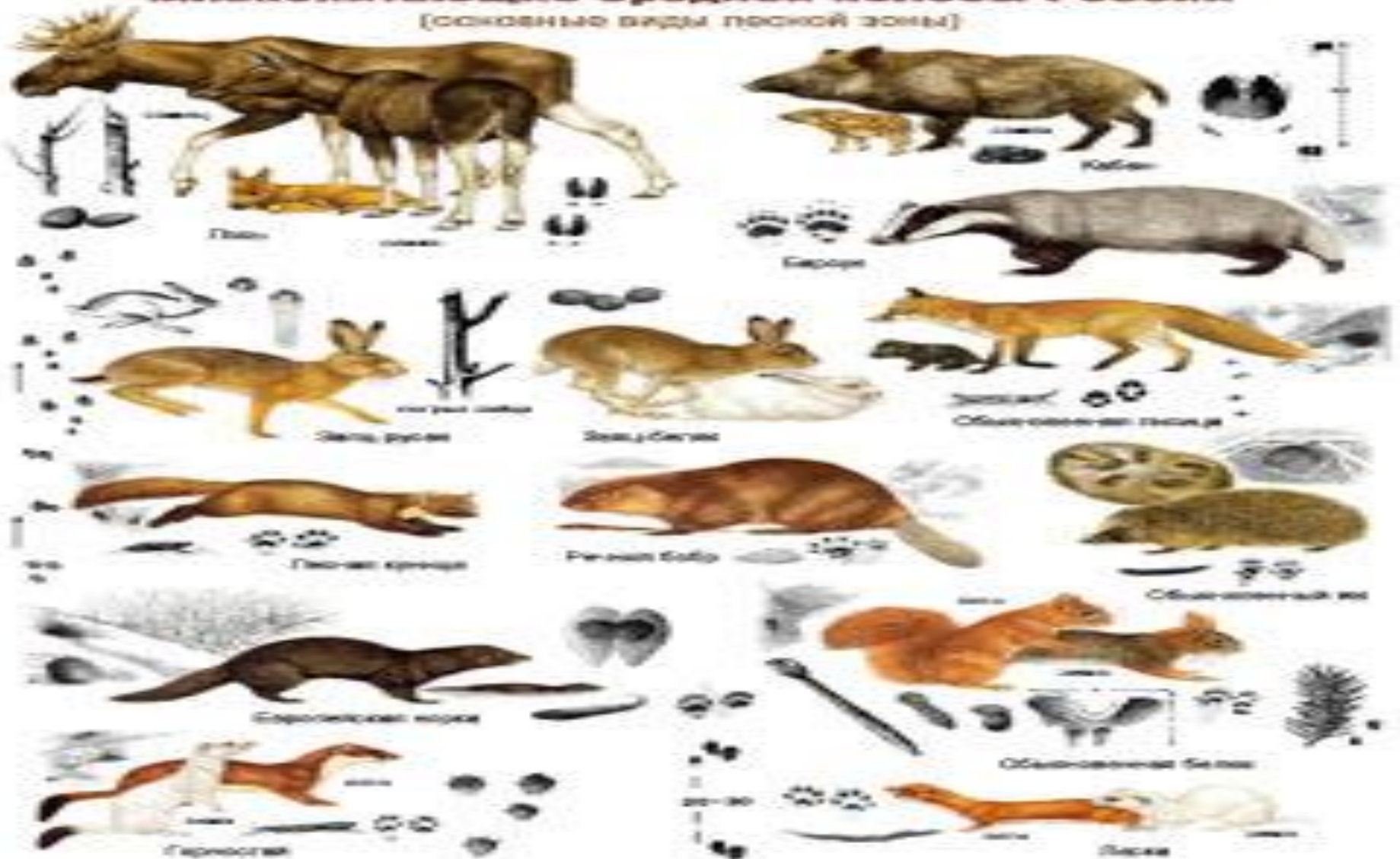
Млекопитающие средней полосы России (основные виды лесной зоны)