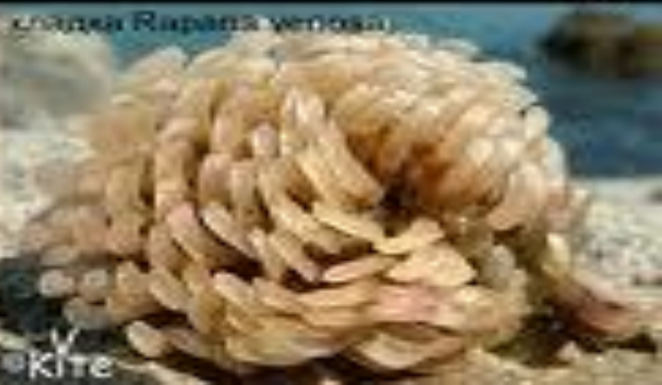
яйца Rapana venosa