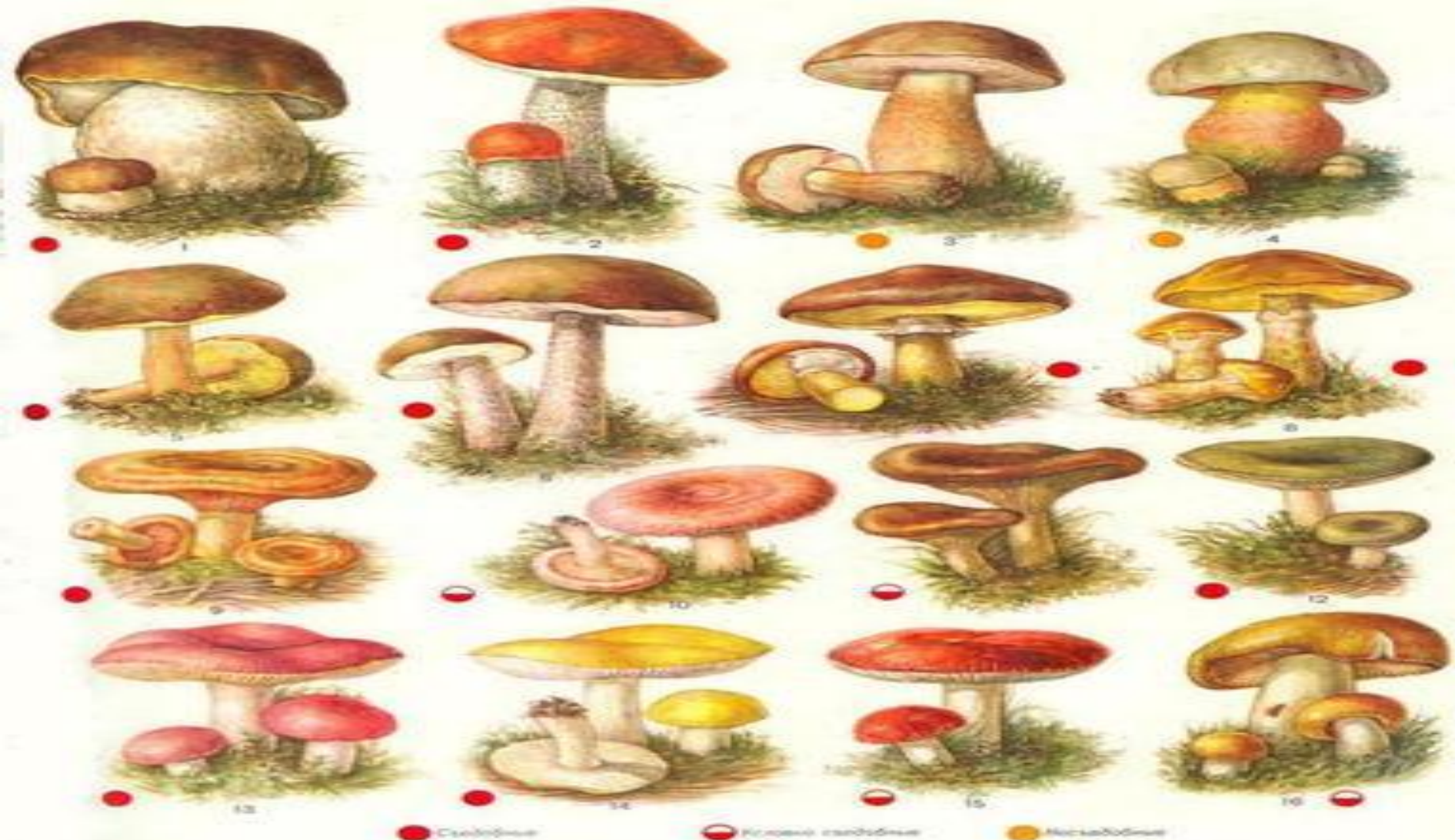
Ж. с. Г. Грибы. 1. Белый. 2. Подосиновик. 3. Желчный. 4. Сатамский. 5. Мясник яловый. 6. Подберезовик. 7. Масленок еловый. 8. Масленок лисичковый. 9. Рыжик. 10. Волнушка. 11. Сыроежка. 12. Сыроежка желтая. 13. Сыроежка черная. 14. Сыроежка желчица. 15. Везувий.