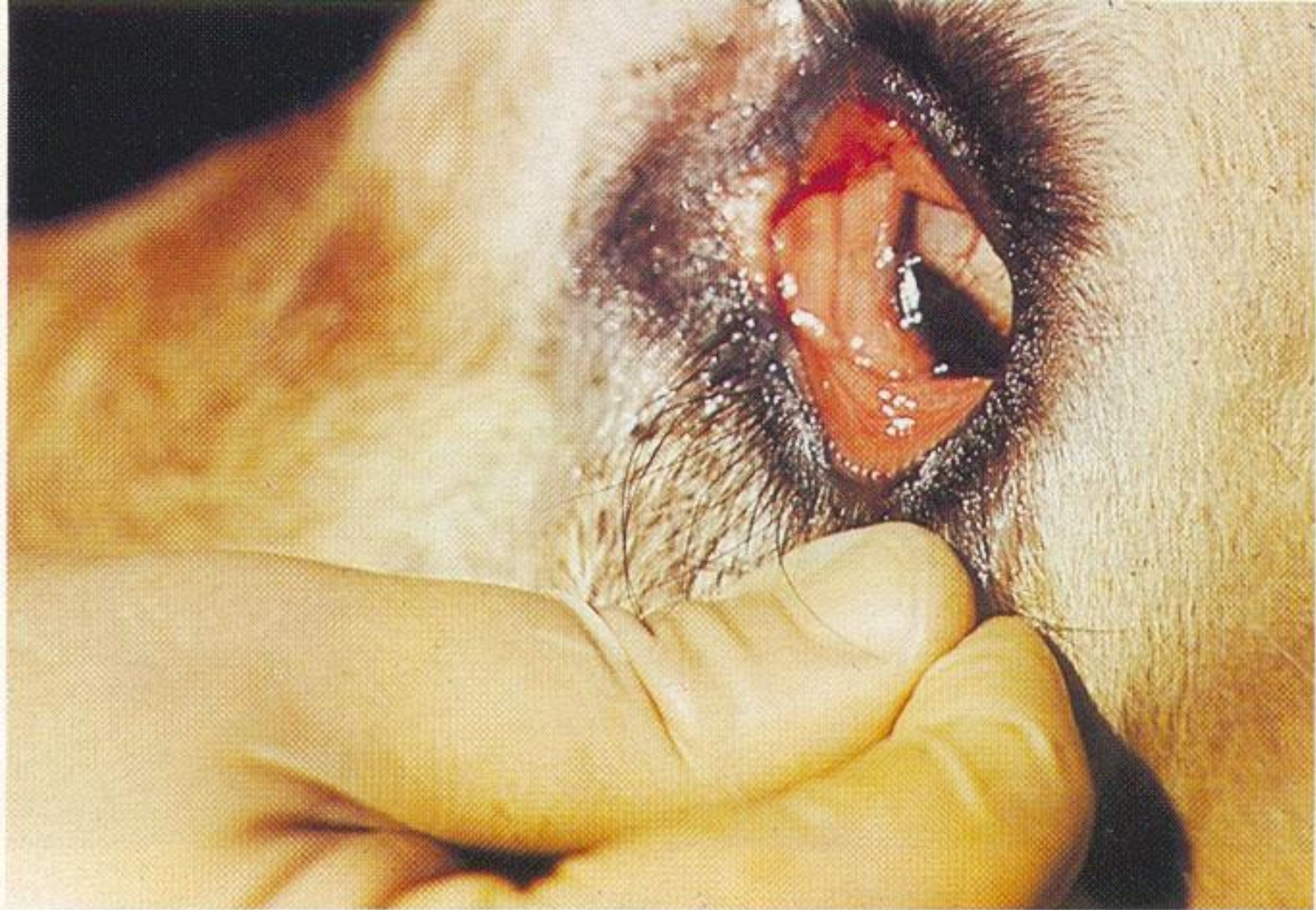
Inflammation of conjunctiva of eye.