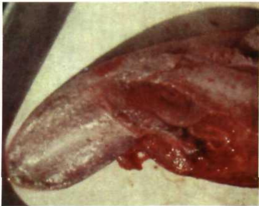
Некротичні ураження нижньої частини язика