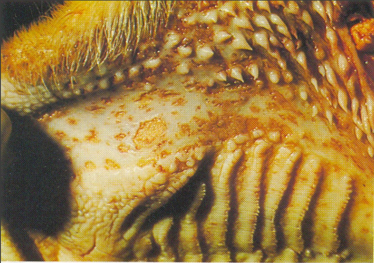
Necrotic lesions on upper cheek and roof of mouth.