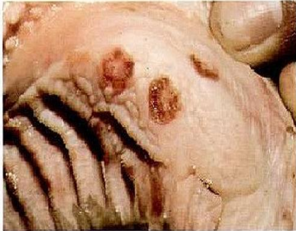
Figure 56.1 Bovine: papular stomatitis: erosions in the mouth