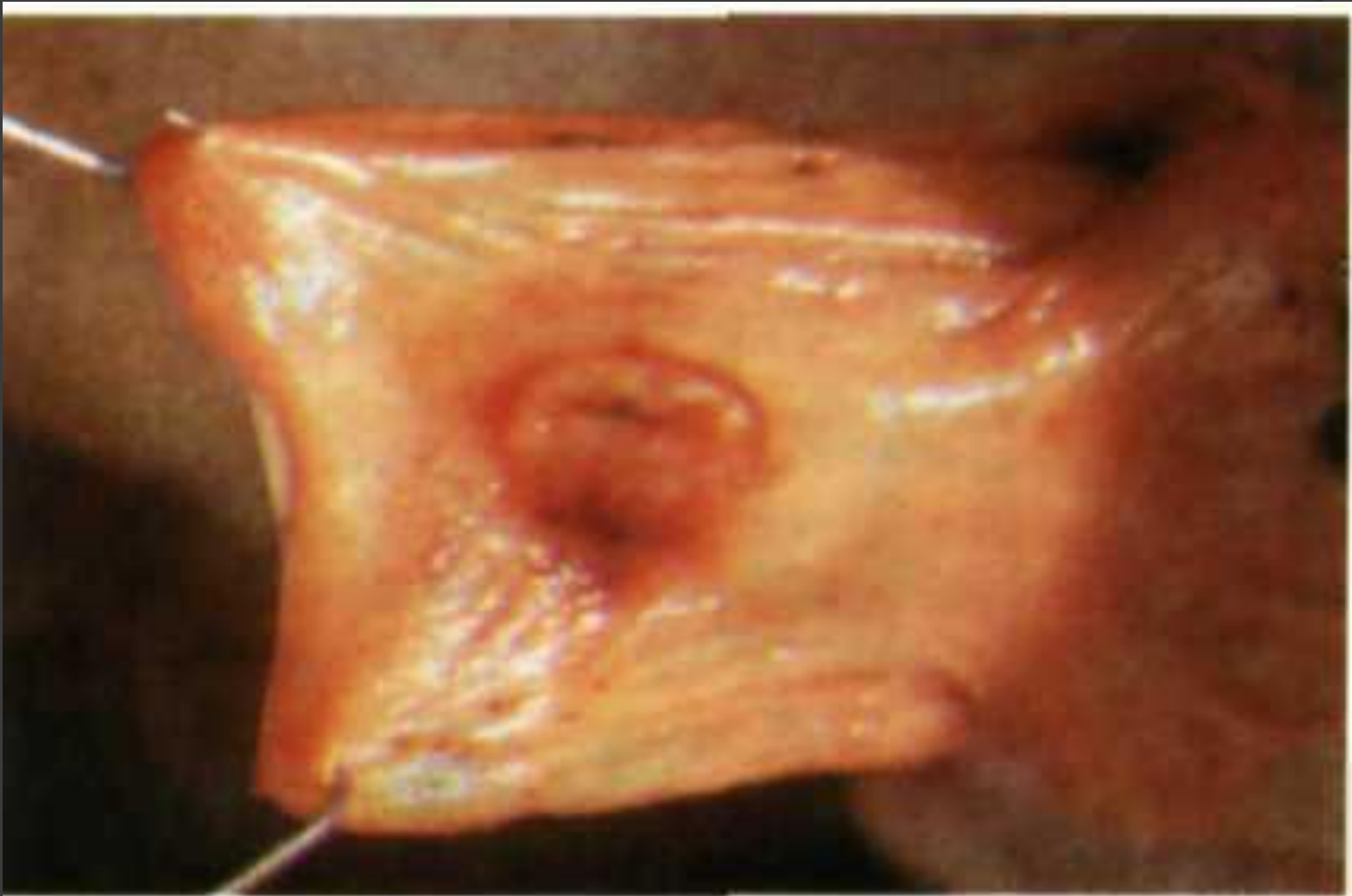
Гіперемія ілеоцекального клапана