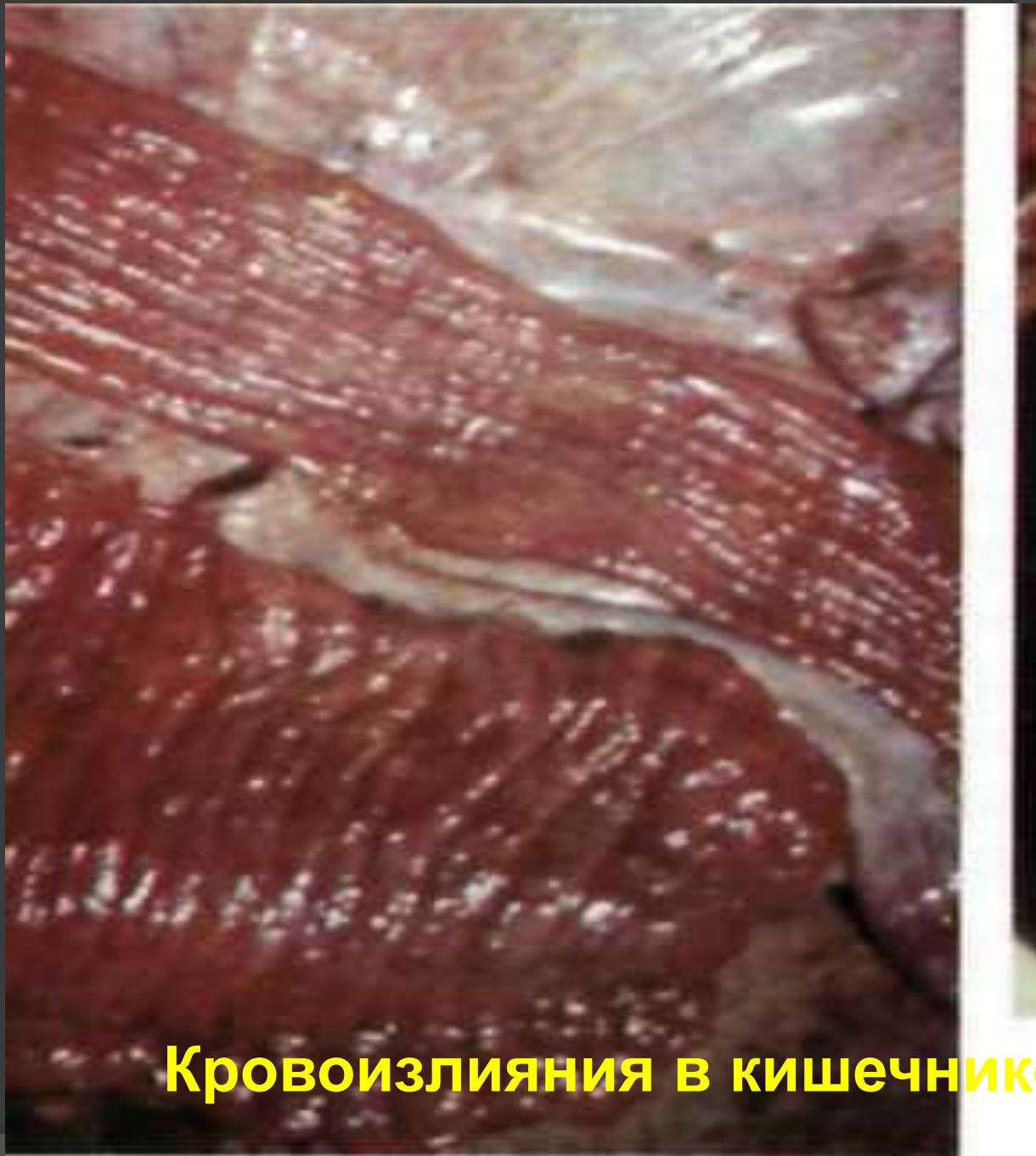
Кровоизлияния в кишечнике