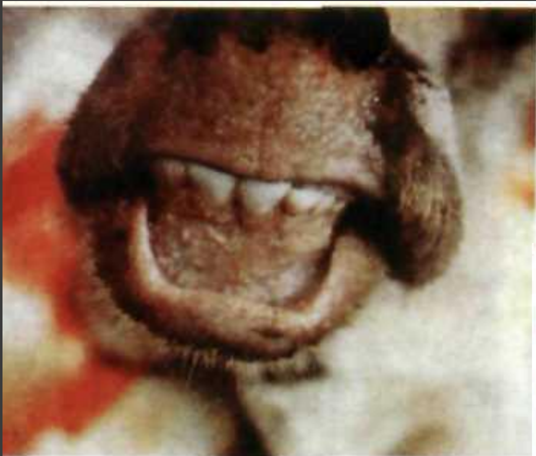
Некротичні ураження слизової оболонки носової порожнини