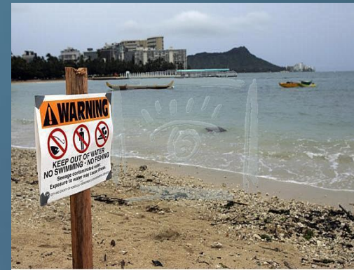
www.kotobank.com 3007-2628 Окей! Темы Противные оживи в городе Гомолу (Kosolul) заплоти канализационную систему, что способствовало загрязнению вода, Гомолу, Гавийские острова, 29 марта 2006. На фото пляж Байбека (Waiiki Beach)