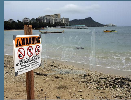
www.kotobank.com 3007-2628 Окей! Темы Противные случаи в городе Гомолю (Kosulju) загрозили канализационную систему, что способствовало загрязнению вода, Гомолю, Гавийские острова, 29 марта 2006. На фото пляж Байбека (Waiiki Beach)