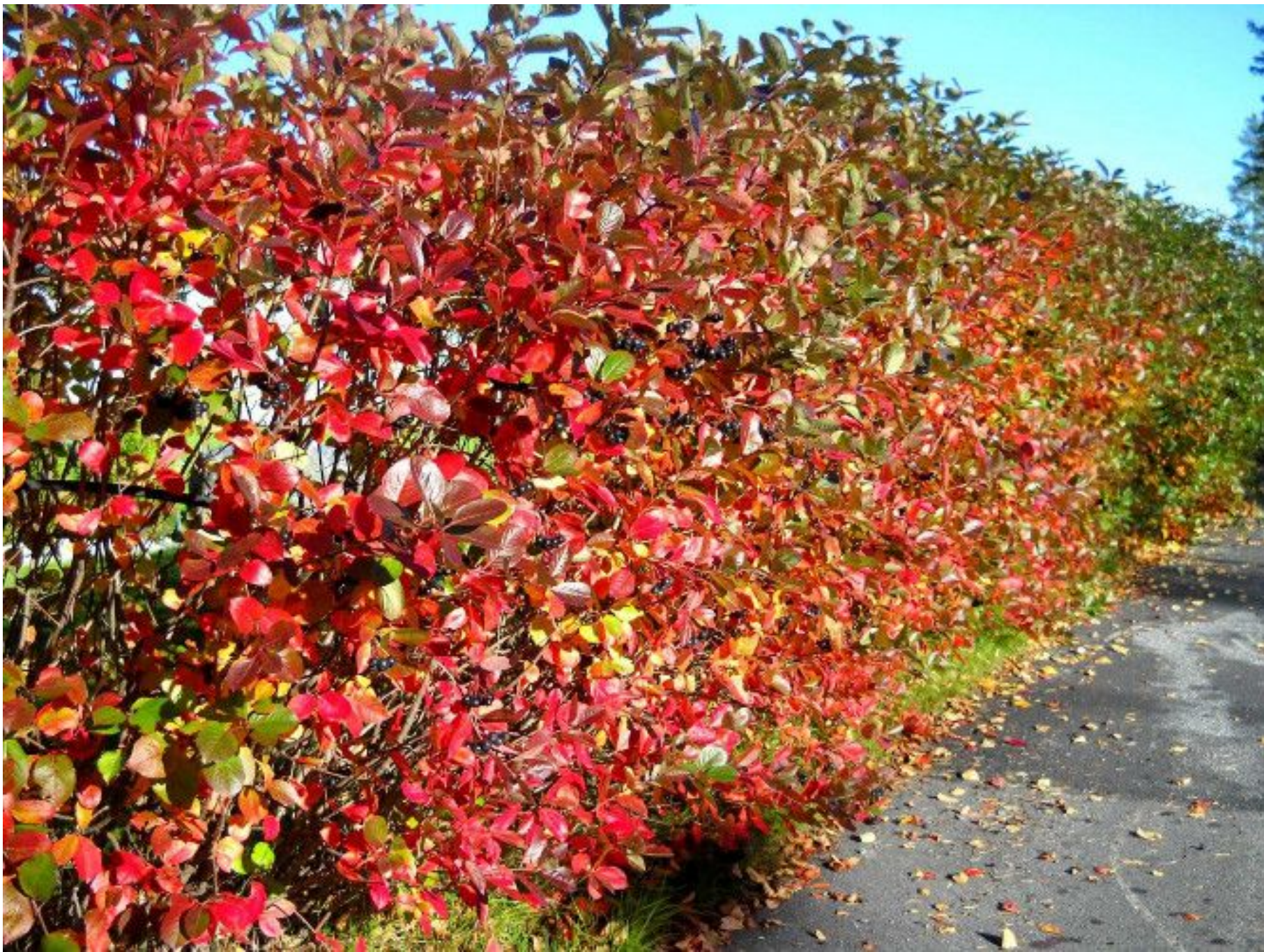
Черноплодна я рябина